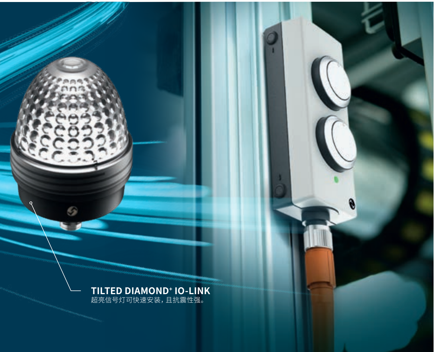
TILTED DIAMOND+ IO-LINK 超亮信号灯可快速安装，且抗震性强。